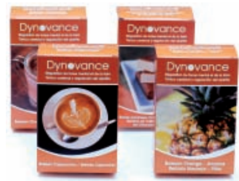
Chocolate, Capuccino o Naranja-Piña

➤ Por la mañana o en el desayuno y/o a medio día según el criterio médico