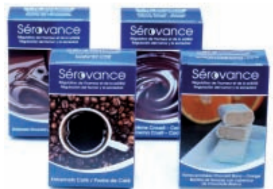
Chocolate, Crusty-cacao o Café

➤ A partir de las 16h y/o merienda y/o cena, según el criterio médico